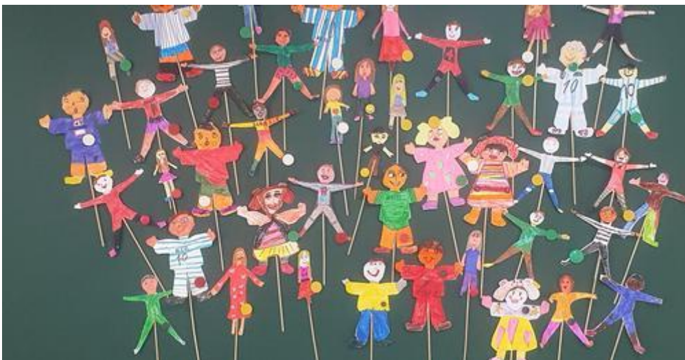
Pailgintos mokymosi dienos grupės mokinių darbas