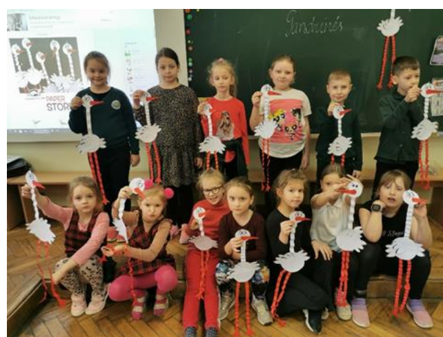
1c pagamino daug gandrų